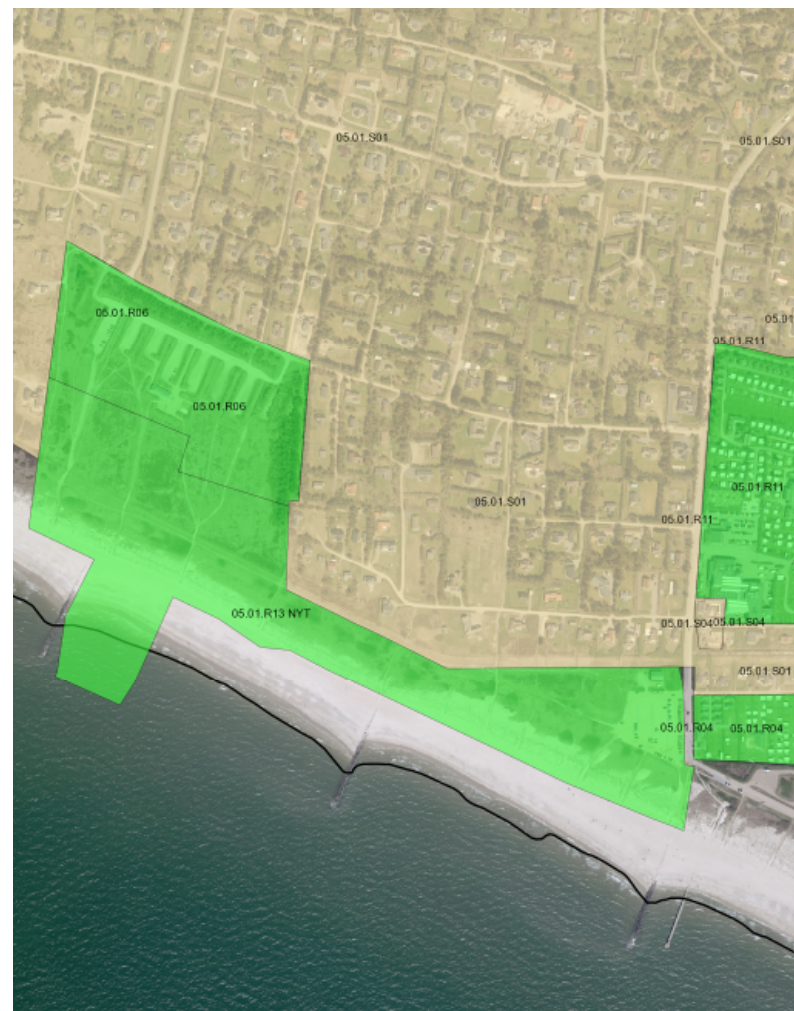
Figur 1 Afgrænsning af nyt rammeområde 05.01.R13 til rekreative formål i form af naturområde.

Lokalplaner, der træffer bestemmelser for rammeområde 05.01.R13, skal være i overensstemmelse med bestemmelserne jf. bilag 1.